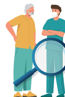
Avec un professionnel de santé