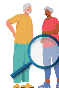
Avec un proche

À la fin du test vous pouvez accéder à des conseils pour rester en forme et préserver votre santé.